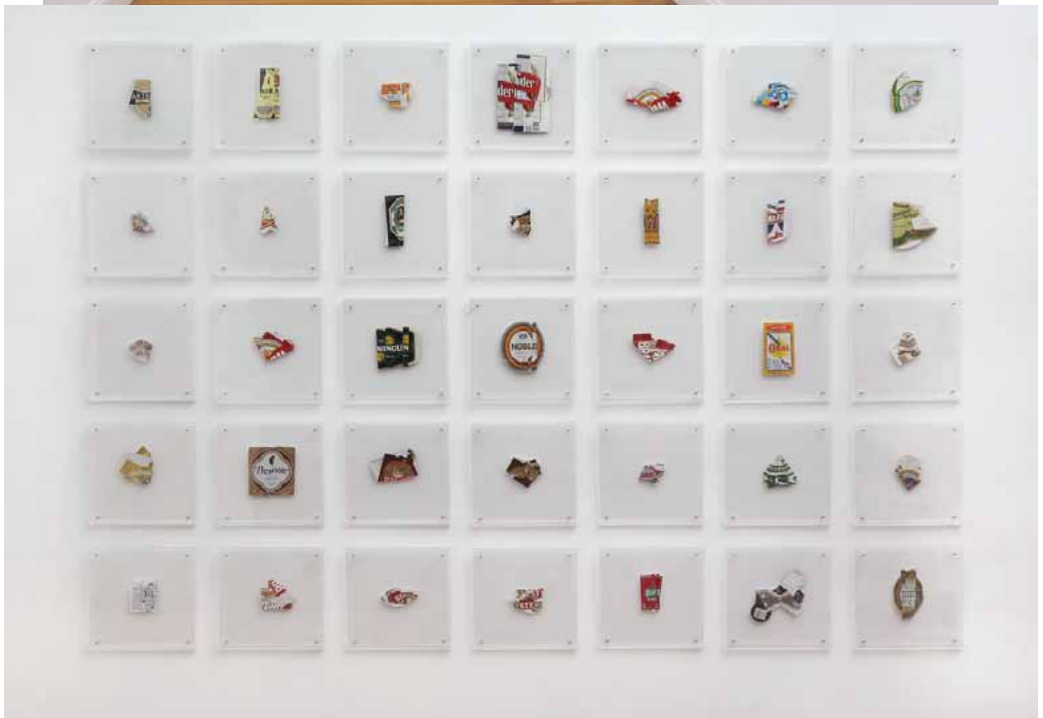
Correspondência , 2007-ongoing Folded beer labels, without cutting or mixing up brands 35 pieces, variable dimensions