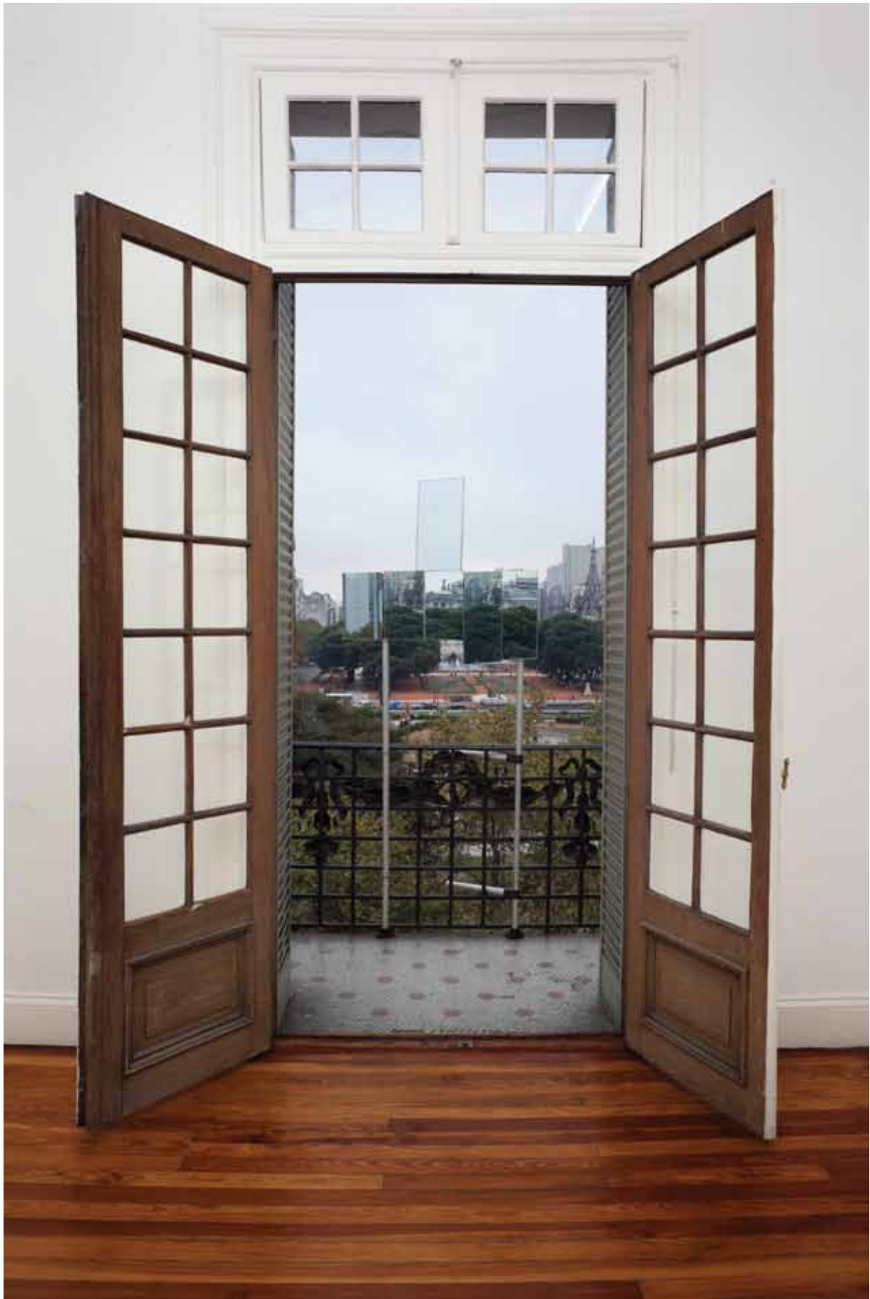
La realidad de un reflejo ( The reality of a reflection ), 2011 Set of mirrors Technical development Augusto Zanela & Gabriela Antenzon