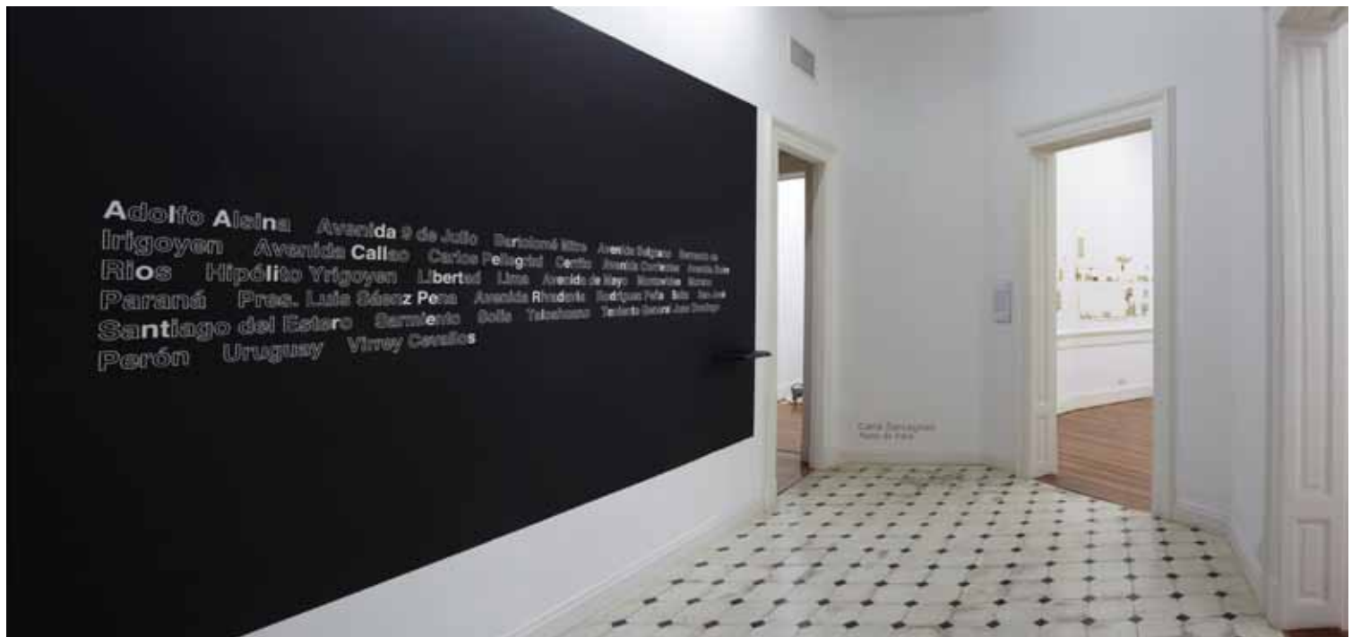
Se essa rua fosse minha , 2009 (versión Buenos Aires, 2011) Proposal to alter street signs´texts by cover up. Painting on wall and rectangular stickers Variable dimensions